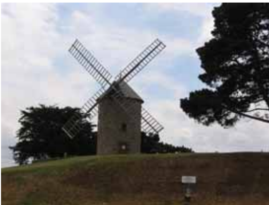
11. Moulin Saint-Michel Saint-Quay-Portrieux Côtes-d'Armor