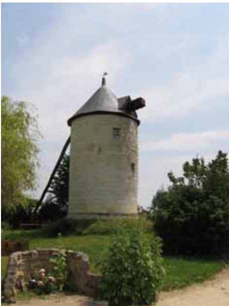
7. Moulin des Basses Terres Les-Rosiers-sur-Loire Maine-et-Loire