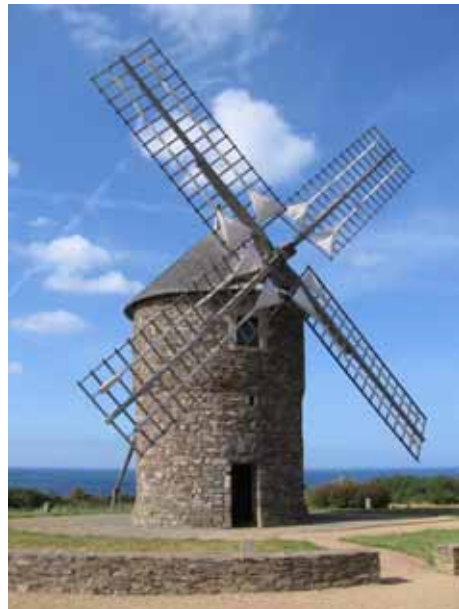
12. Moulin de Craca Plouézec Côtes-d'Armor