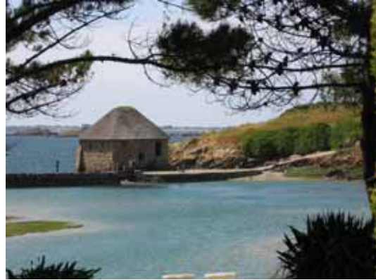
14. Moulin à marée du Birlot Île de Bréhat Côtes-d'Armor