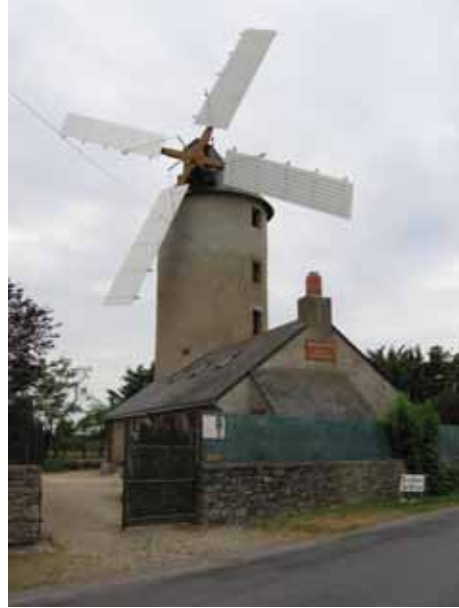
18. Moulin de la Fée St-Lyphard Loire-Atlantique