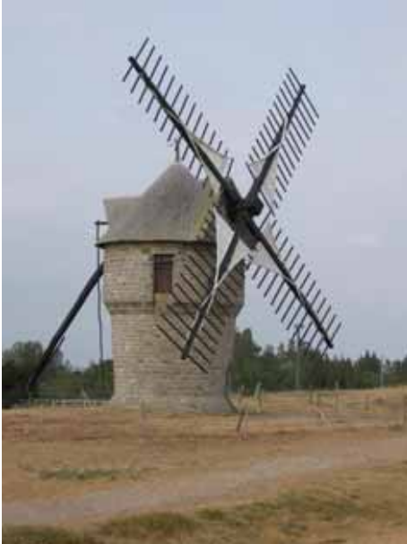
19. Moulin de la Falaise Batz-sur-Mer Loire-Atlantique