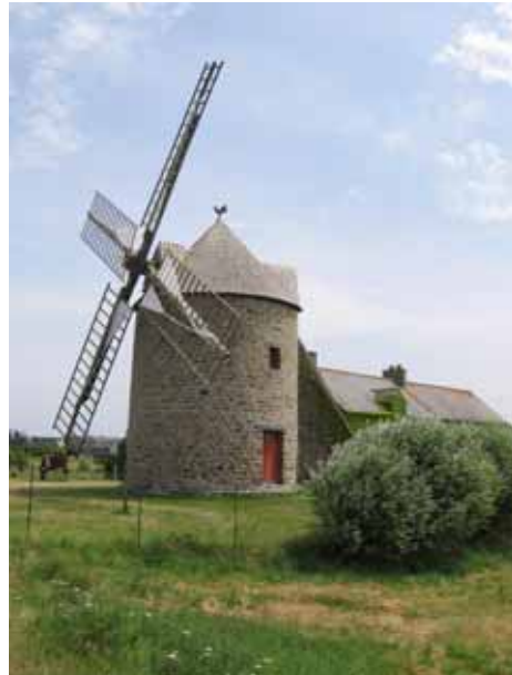
16. Moulin du Tertre Mont-Dol Ille-et-Vilaine