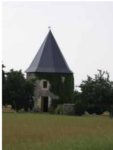
8. Moulin de la Roche Mazé Maine-et-Loire