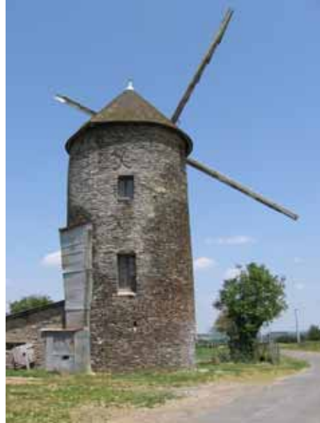
10. Moulin du Rat (information, p. 64) Challain-la-Potherie Maine-et-Loire