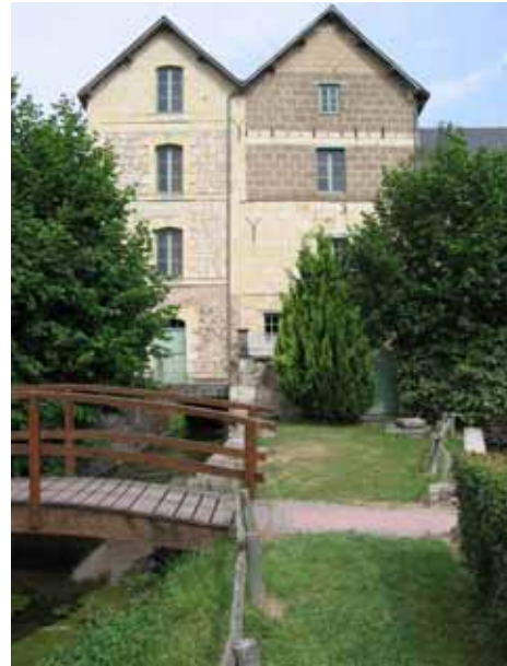
6. Moulin à eau de Sarré Gennes Maine-et-Loire