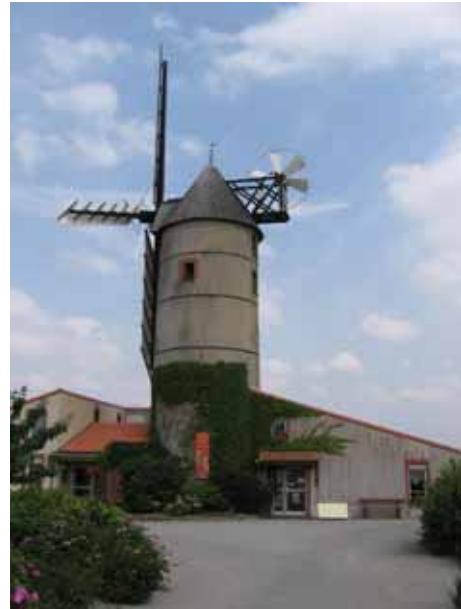
2. Moulin de l'Épinay La Chapelle-Saint-Florent Maine-et-Loire