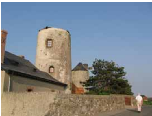
3. Moulins d'Ardenay Chaufonds-sur-Layon Maine-et-Loire