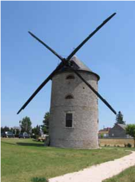
1. Moulin de Pierre Artenay Loiret