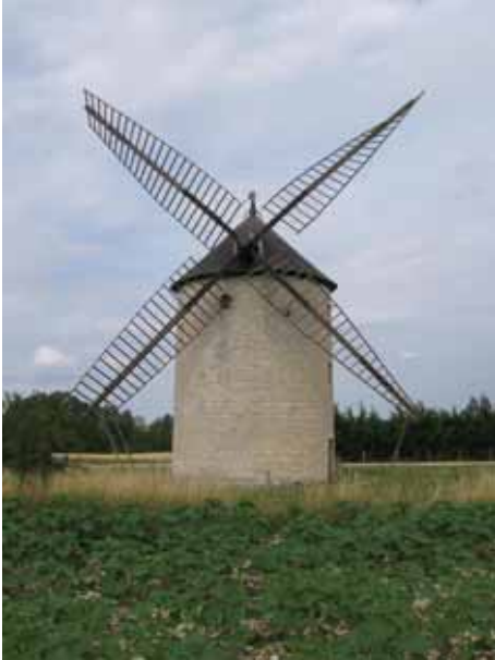
23. Moulin de Nouan Chezal Benoît Cher