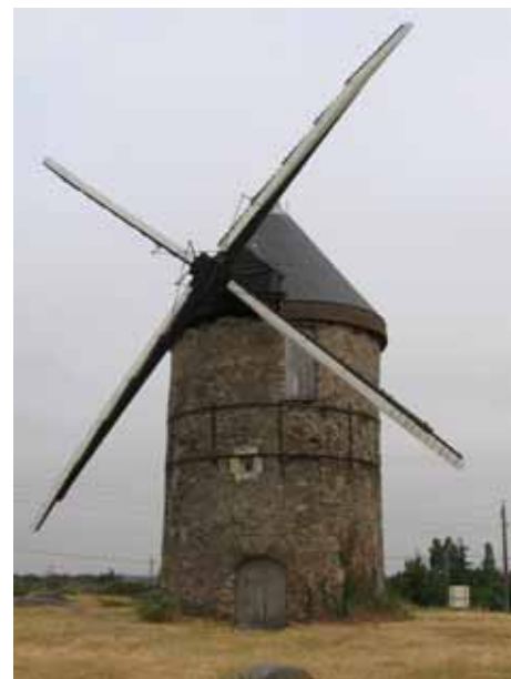
4. Moulin de la Roche La Possonnière Maine-et-Loire