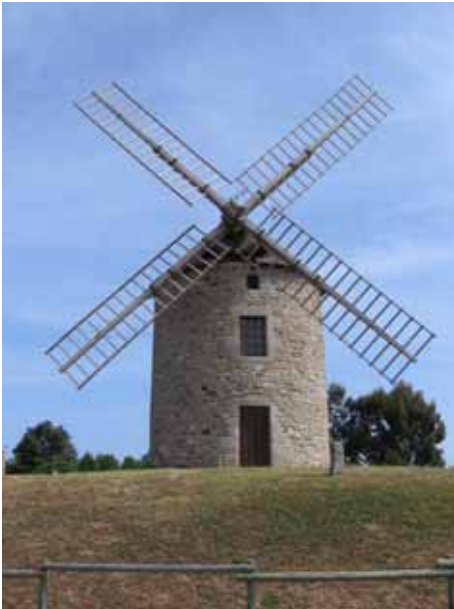
15. Moulin de Buglais Lancieux Côtes-d'Armor