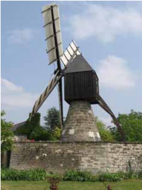
5. Moulin Gouré Louresse-Rochemenier Maine-et-Loire