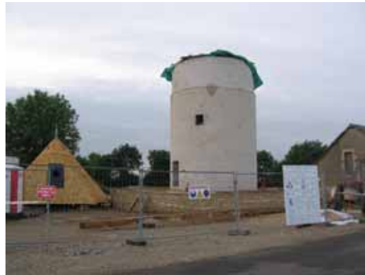
24. Moulin des Éventées Saint-Pierre-le-Moûtier Nièvre