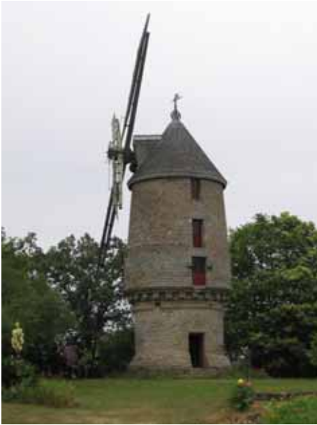
21. Moulin de la Pâquelais Savenay Loire-Atlantique