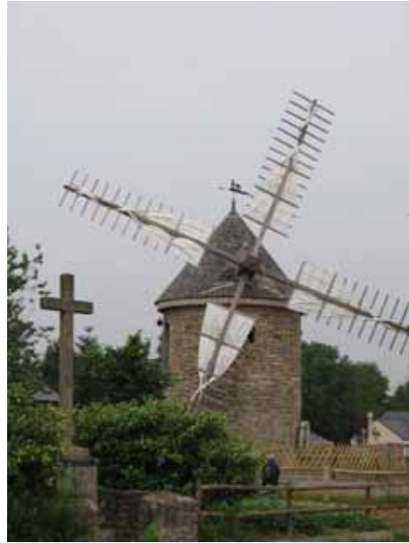
22. Moulin Neuf Vigneux-de-Bretagne Loire-Atlantique