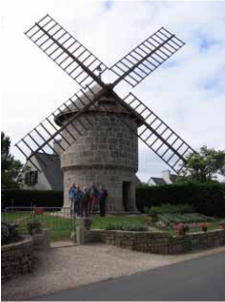
13. Moulin Crec'h Olen Ploulec'h Côtes-d'Armor