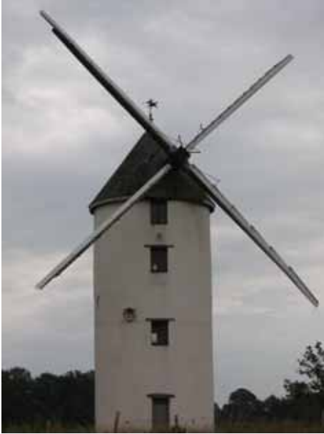
17. Moulin de la Bicane Campbon Loire-Atlantique