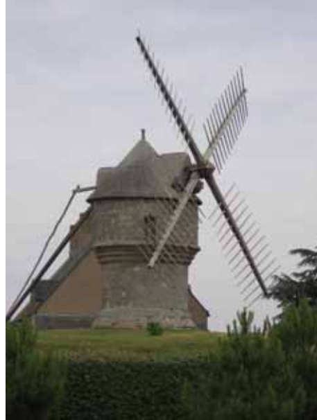
20. Moulin du Diable Guérande Loire-Atlantique