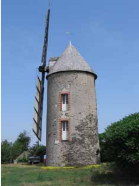
9. Moulin Neuf Angrie Maine-et-Loire